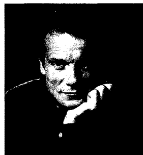
Massimo Ranieri Anche il popolare cantante ha ottenuto il riconoscimento di Testimone del Tempo